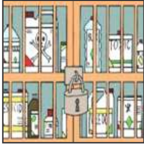
कीटनाशकों को ताले में रखें