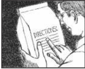
लेबल को ध्यान से पढ़ें